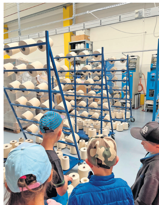
Die Authausener „Mühlenmäuse“ waren in den letzten Wochen unter anderem bei der Bad Dübener Seilerei Voigt zu Gast.

Ein weiteres Projekt unserer Vorschüler konnten wir durch die Seilerei Voigt umsetzen. Die Kinder gewannen einen Einblick ins Handwerk. Wir beobachteten unter anderem, wie ein Springseil und eine Schaukel hergestellt wird. Mit allen gesammelten Eindrücken und neuen Kenntnissen